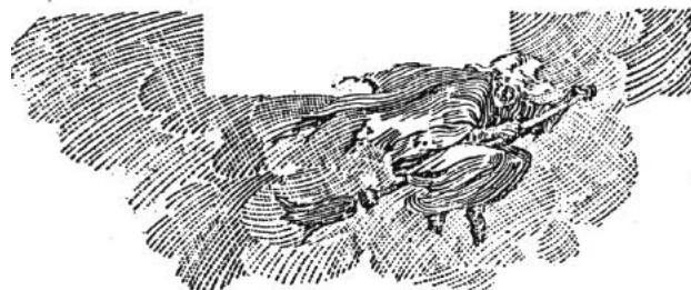
Table des matières du " Diable en Belgique " Roberto J. PAYRO (ou Payró ) : IEA3637 PARTIE 1 (pages I-37 : " LE DIABLE ARCHITECTE ", " UNE CREATURE