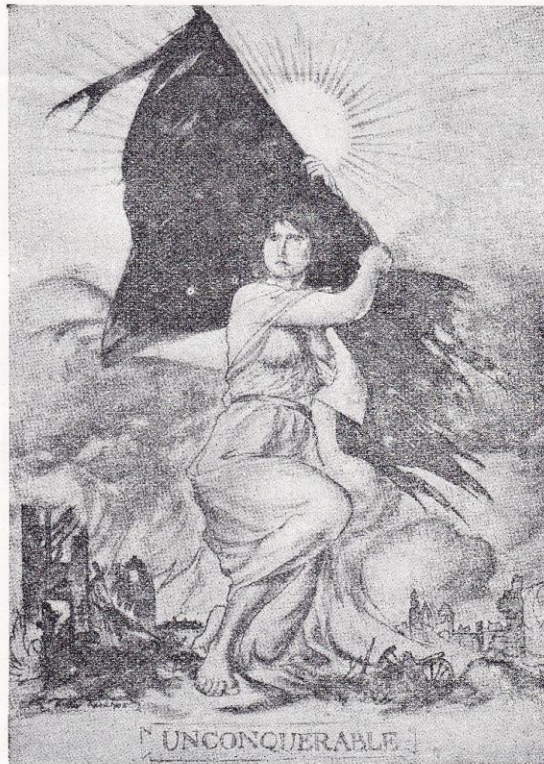
La Belgique indomptable, par Arthur Rackham. (King Albert's book.)

du gouvernail. Chaque année, composé de tous les conseillers qu'il était possible de rassembler, il s'est réuni, s'arrogeant le titre d'assemblée générale, et cette assem-